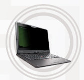
Filtre de confidentialité