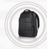
Sac à dos ThinkPad Professional