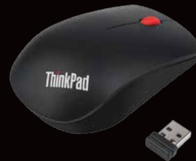
◀ Souris sans fil ThinkPad Essential