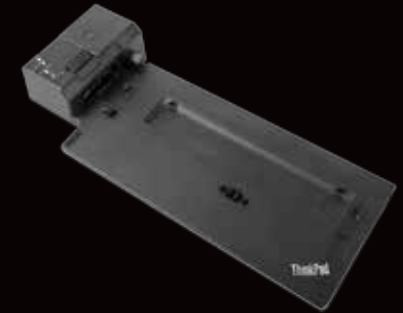
Station d'accueil ▶ ThinkPad Pro Dock