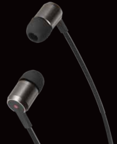
Écouteurs intra- ▶ auriculaires Lenovo