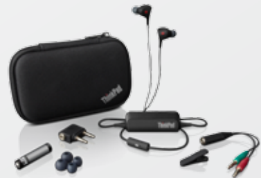
Écouteurs intra-auriculaires à filtrage de bruit pour ThinkPad