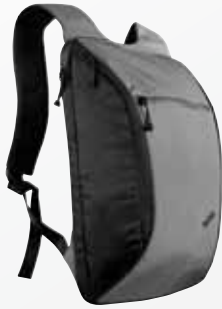
Sac à dos ultraléger pour ThinkPad®