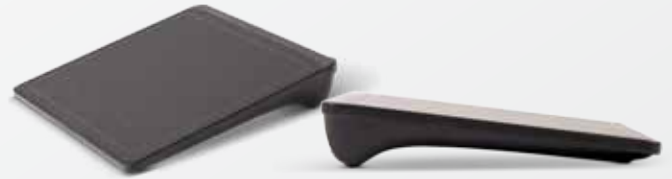
Pavé tactile sans fil Lenovo® (pour modèles non tactiles)