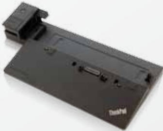
Nouvelle station d'accueil ThinkPad pour améliorer la sécurité, les connexions et l'alimentation