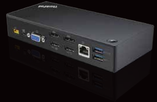
Lenovo ThinkPad USB-C- Andockstation