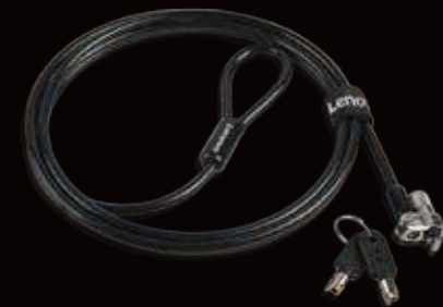
Câble de sécurité ▶ Kensington MicroSaver 2.0