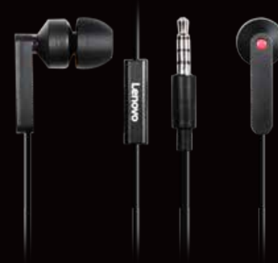
◀ Écouteurs intra-auriculaires Lenovo