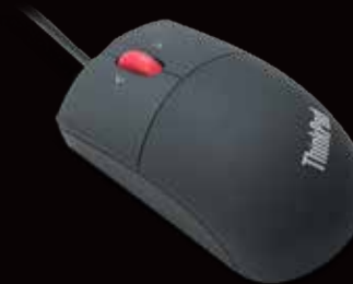
◀ Lenovo ThinkPad USB-Lasermaus