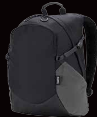
Zaino ThinkPad Active ▶