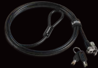
Cavo di sicurezza ▶ Kensington MicroSaver 2.0