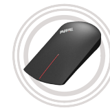
ThinkPad® X1 Wireless- Touch-Maus