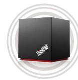
Unidad de expansión WiGig de ThinkPad®