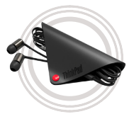
Auriculares de botón ThinkPad® X1