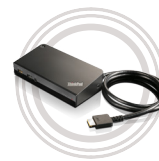
Unidad de expansión OneLink+ de ThinkPad®