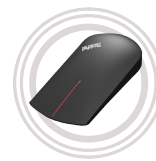
Ratón táctil inalámbrico para ThinkPad® X1