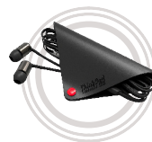
ThinkPad® X1 In-Ohr-Kopfhörer

Exzellente Soundqualität und hoher Tragekomfort