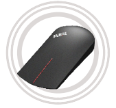
ThinkPad® X1 Wireless-Touch- Maus

Drahtlos verbinden und neue Funktionen mit Ihrem Gerät nutzen