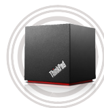
ThinkPad® WiGig Dock

Exzellente Soundqualität und hoher Tragekomfort